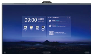
MAXHUB V6 Tシリーズ